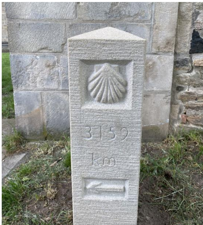
Svatojakubský patník v obci Jakub.